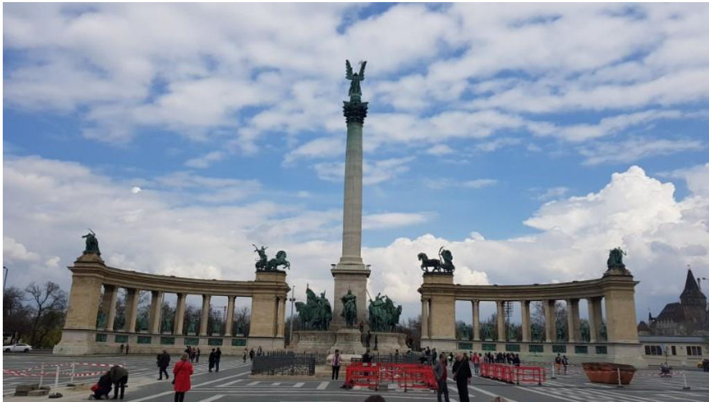
Her er Hero Square, som ligger veldig sentralt i Budapest og er et anerkjent landemerke.