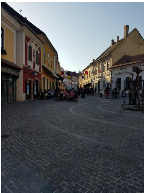
Her er hovedplassen i Szentendre, som er et slags knytopunkt for alle gatene og restaurantene.